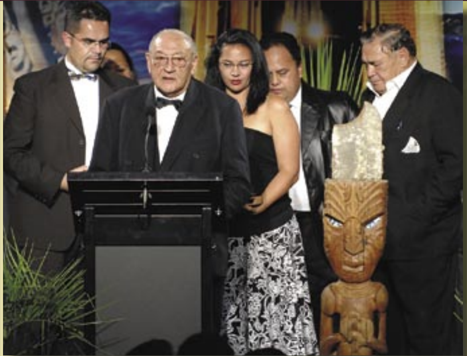
Te Reo Irirangi o Te Mānuka Tūtahi – i toa rātau mō te hōtaka Reo Māori Tiketike i ngā Tohu Pāpāho Māori