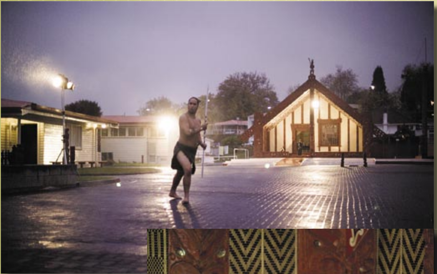
Te Pōwhiri i timataria i te hui Tāpoi Tūtakinga o Aotearoa (TRENZ) 2007

E ai kī ngā kōrero o te ao tāpoi o Aotearoa, kāore he hui i tua atu i te hui o Te Tāpoi Tūtakinga o Aotearoa (TRENZ).