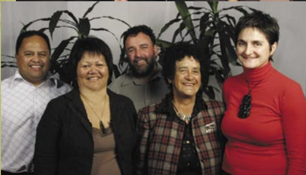
Te ekenga o Huhana me tana whānau ki Te Taura Whiri i te Reo Māori