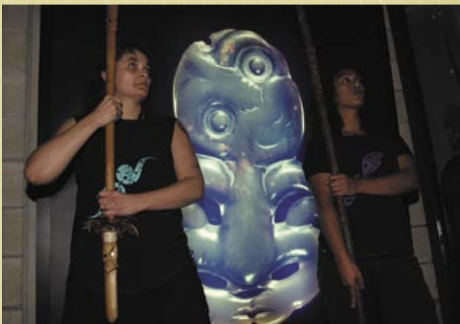
Ngā wahine toa, mau rākau

Koiane i te auē a Te Taura Whiri i te Reo Māori mai i te aranga ake o te rōpū nei. Kai te haere tonu tā rātau auē i tēnei wā. He aha te mahi a Te Taura Whiri i te Reo Māori? Me kī he kaitiaki rātau nō tō tātau reo. He poi poi, he whāngai, he arahi i te huarahi kia kore ai e hemo, e ngaro ki te pō. Ka tuhaina mai wētahi kupu hai tāpiri atu ki te reo o tēnei wā, ngā kupu i hauhaketia ake nō te ao tawhito, ngā kupu hai turaki atu i ērā i hangaia mō ngā kupu hōu a-tau iwi. E whakamahara tonu ana i ngā wā katoa, he taonga te reo. Āe, he tino taonga e hika mā! Kai a tātau tonu, kai te iwi te rongoā mō te oranga o tō tātau reo. Nonoketia, kōrerotia i ō tātau kāinga, i runga i ō tātau marae, i waenga pārae arā, atu arā atu i ngā wā katoa. Heoi anō tā te Taura Whiri he āwhina, he whakahau, he tautoko mai i a tātau, i ngā kaiwhakaako, i ngā kaimahi, i ngā kaihautū o ngā whare whakaaroranga katoa huri i te motu. Kia aroha ki tō tātau reo rangatira e hika mā.